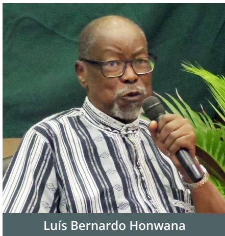
Luís Bernardo Honwana

No geral, consideram que a atribuição do nome “Universidade Eduardo Mondlane” cumpriu os seus propósitos porquanto as decisões que se seguiram à nova designação alteraram pela positiva a dinâmica de formação de quadros no país, com realce para a ampliação do acesso dos moçambicanos ao ensino superior.