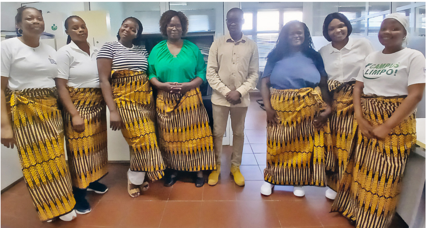
O 7 de Abril não passou despercebido no Centro de Comunicação e Marketing