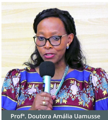
Prof.ª Doutora Amália Uamusse

O impacto na empregabilidade é ainda reforçado por programas de bolsas, como